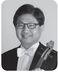
小野 富士 (おのひさし)

1981年東京芸大卒。92年モルゴア・クアレルテット結成に参画。98年第10回「村松賞」受賞。2001年、2010年度「アリオ賞」受賞。2005年レッスンの友社からヴァイオリンのガイドブック(おのひさしおのひさし)を刊行。2005年マイスター・ミュージックからソロアルバム「ヒンデミット」無伴奏ヴァイオリン作品25-1をリリース。東京フィルハーモニー交響楽団副首席奏者を経て1987年からNHK交響楽団ヴァイオリン首席奏者。